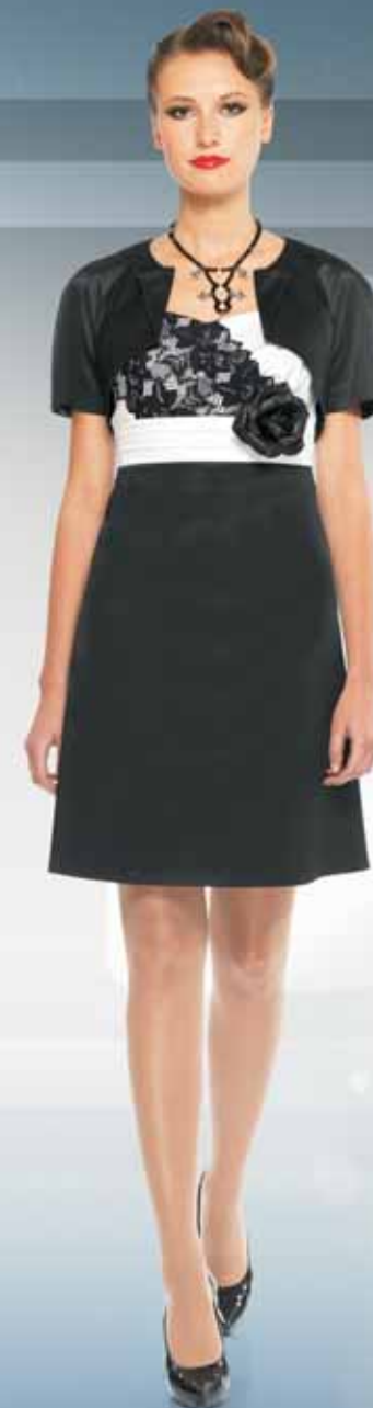
Жакет 11082 Р-ры 42-54