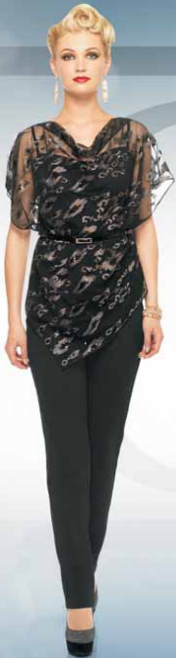
Блуза 21322 Р-ры 42-54