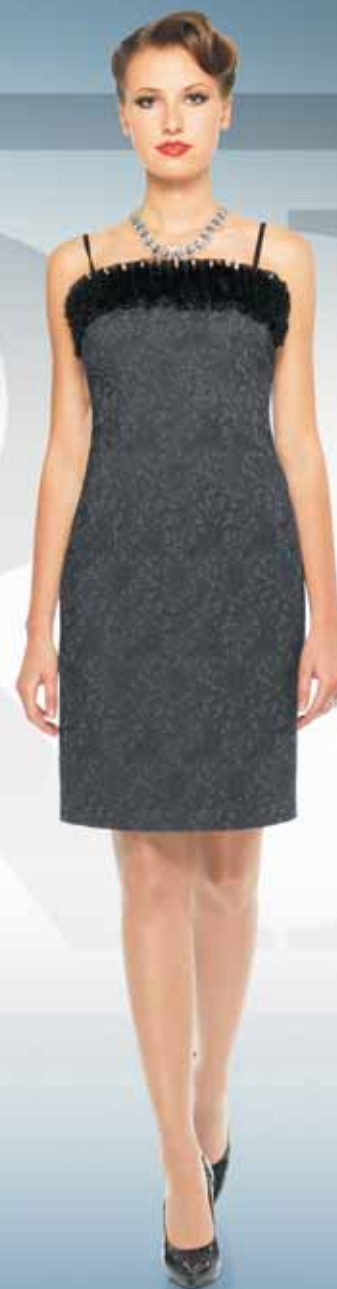
Платье 61122 Р-ры 42-54