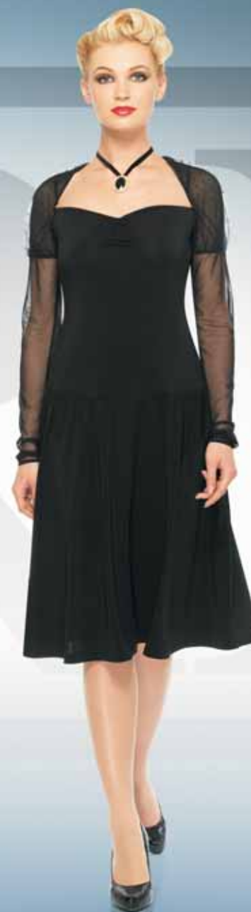
Жакет 11902 Р-ры 42-52