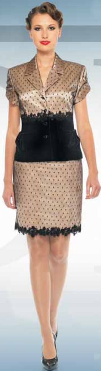
Жакет 11282 Р-ры 42-54