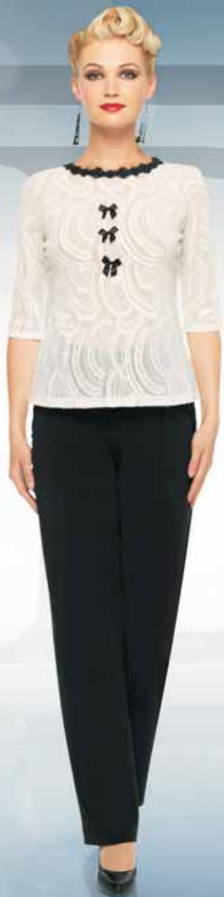
Блуза 21822 Р-ры 42-54