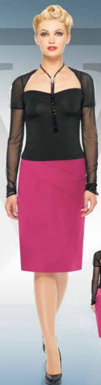
Жакет 11902 Р-ры 42-52 Юбка 41852 Р-ры 42-54