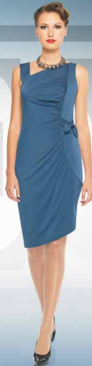
Платье 61092 Р-ры 42-52