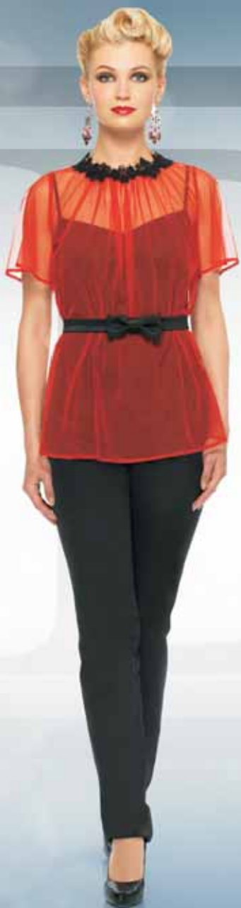
Блуза 21442 Р-ры 42-52