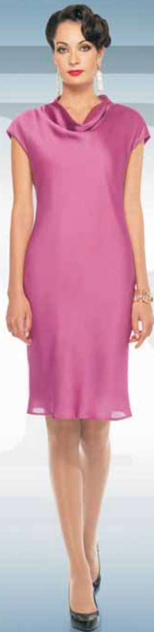
Платье 61872-9 Р-ры 42-54