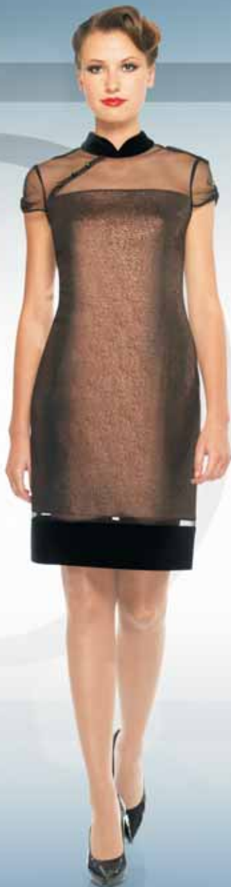
Платье 61252 Р-ры 42-54