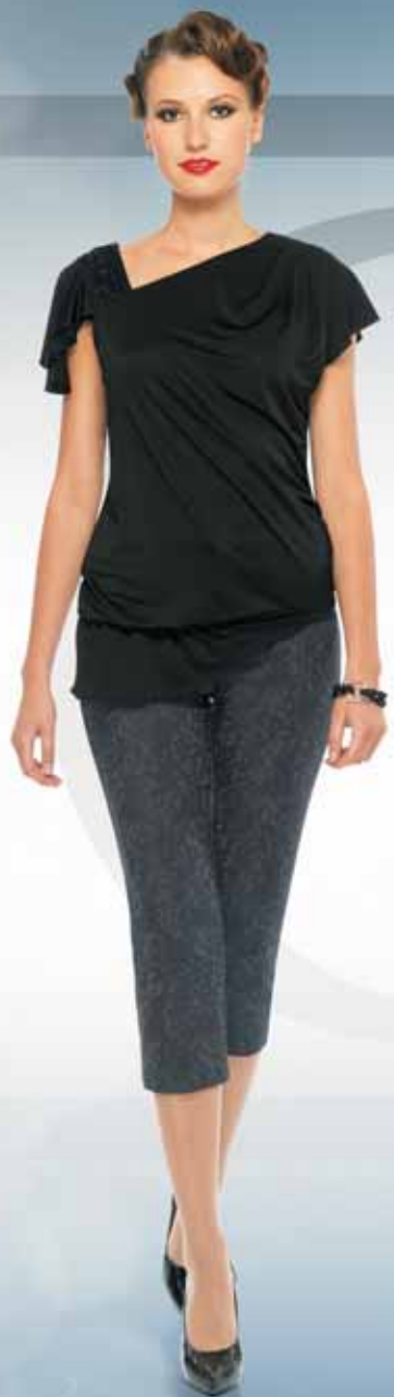
Блуза 21572 Р-ры 42-54