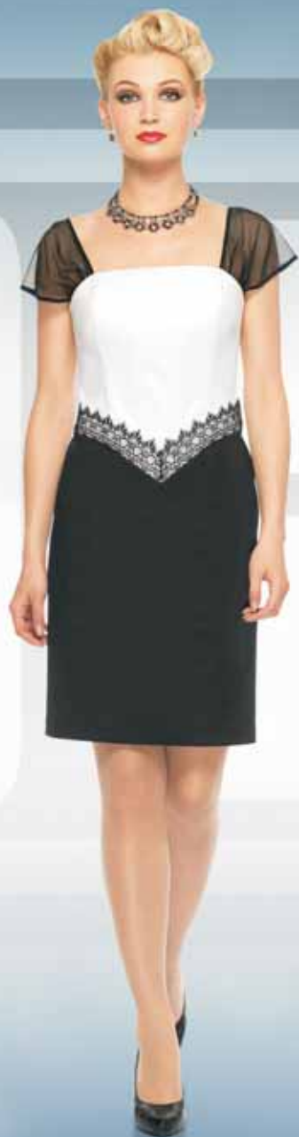
Платье 61202 Р-ры 42-52