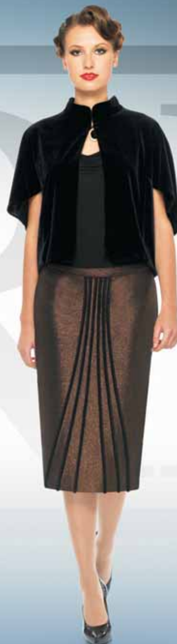
Жакет 11922 Р-ры 42-54