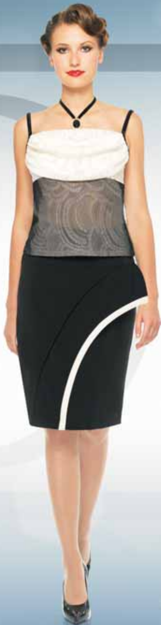
Юбка 41402 Р-ры 42-52