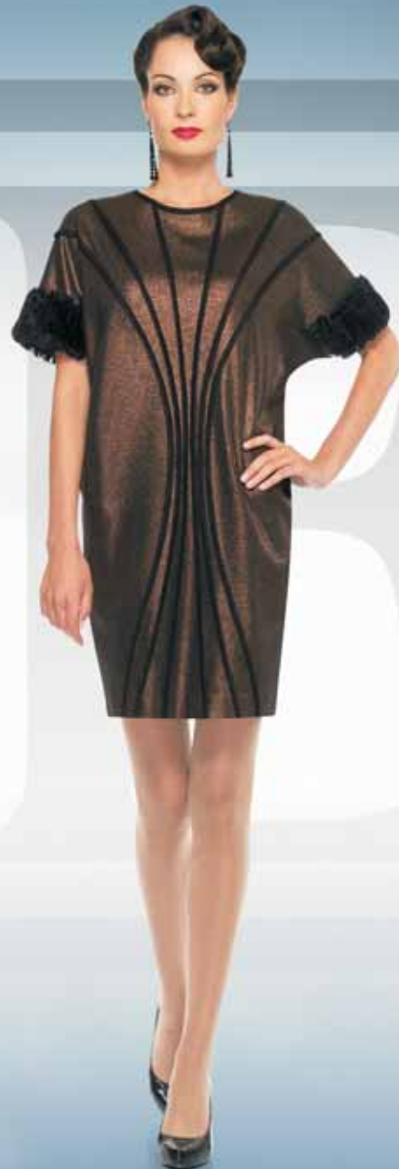
Платье 61612 Р-ры 42-54