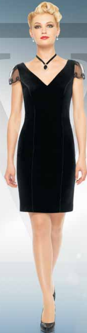
Платье 61342 Р-ры 42-54