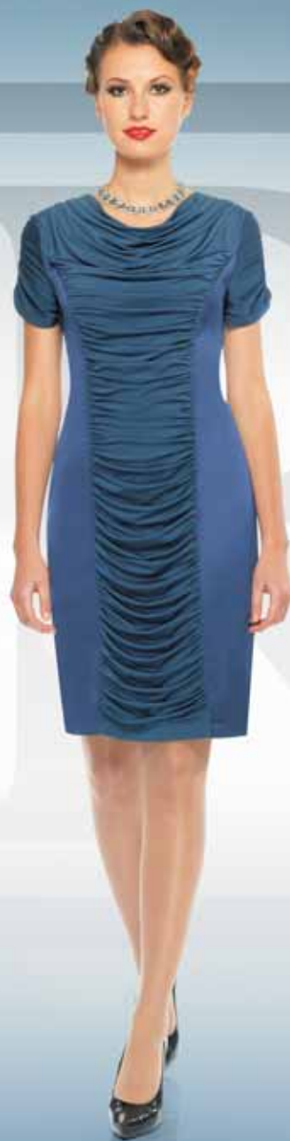
Платье 61482 Р-ры 42-54