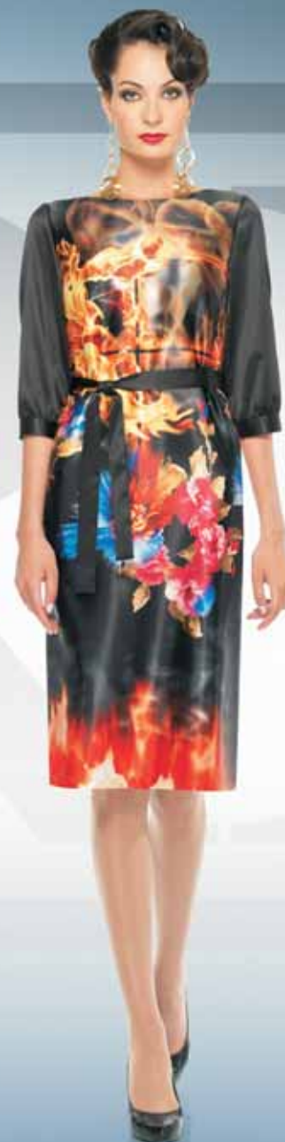
Платье 61632 Р-ры 42-54