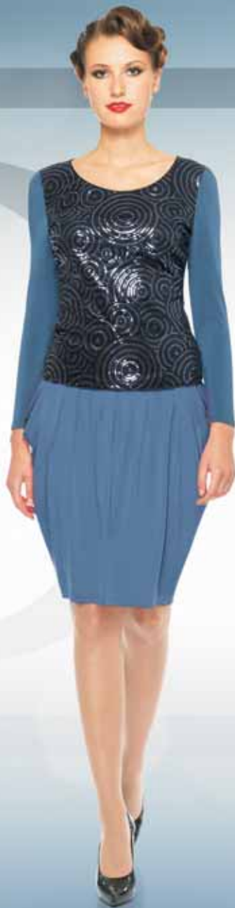
Блуза 21032 Р-ры 42-54