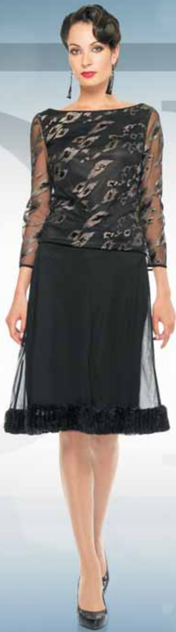
Блуза 21042 Р-ры 42-54 Юбка 41022 Р-ры 42-54