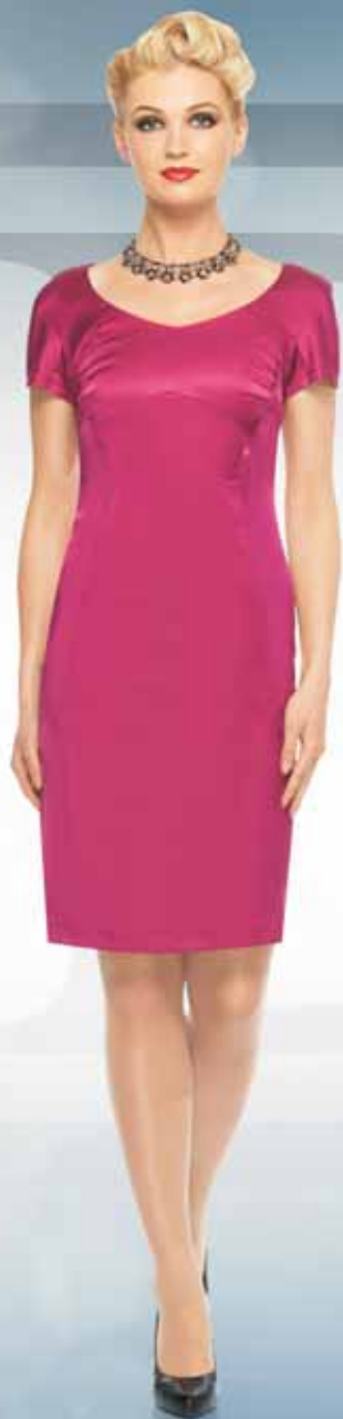
Платье 61222 Р-ры 42-54