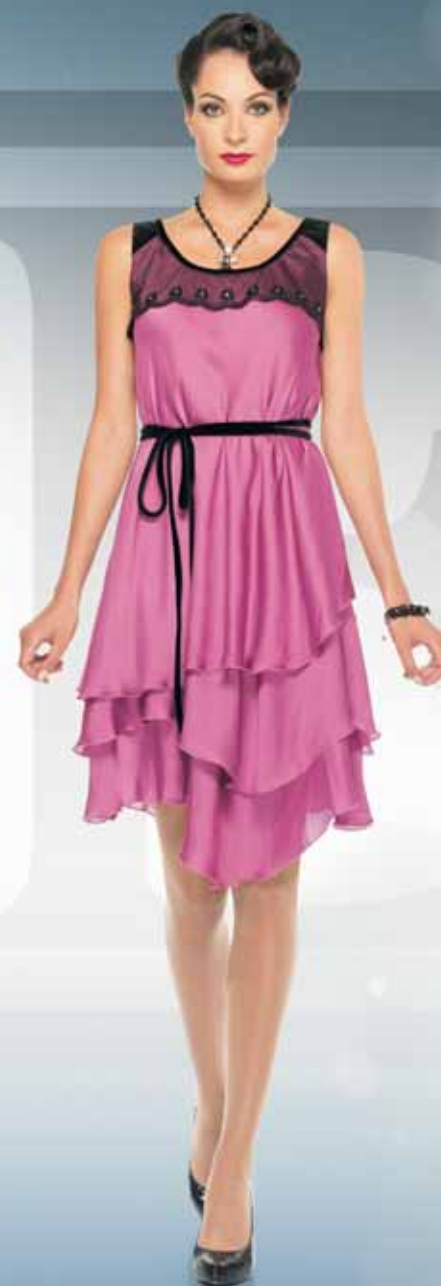
Платье 61302-9 Р-ры 42-52