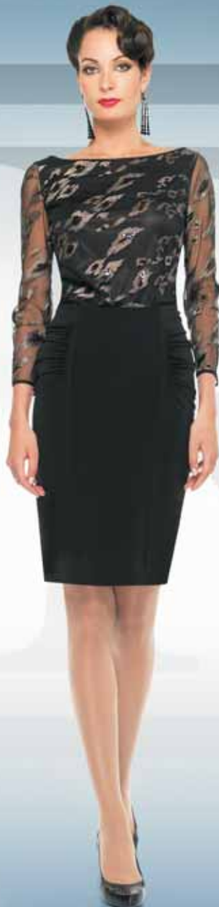
Блуза 21042 Р-ры 42-54