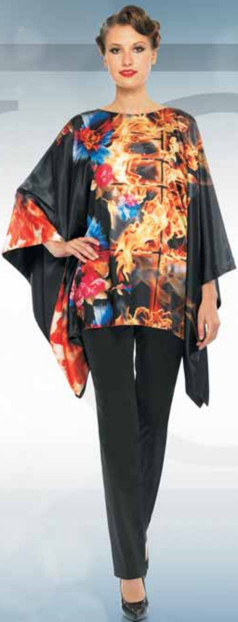
Блуза 21642 Р-ры 42-54