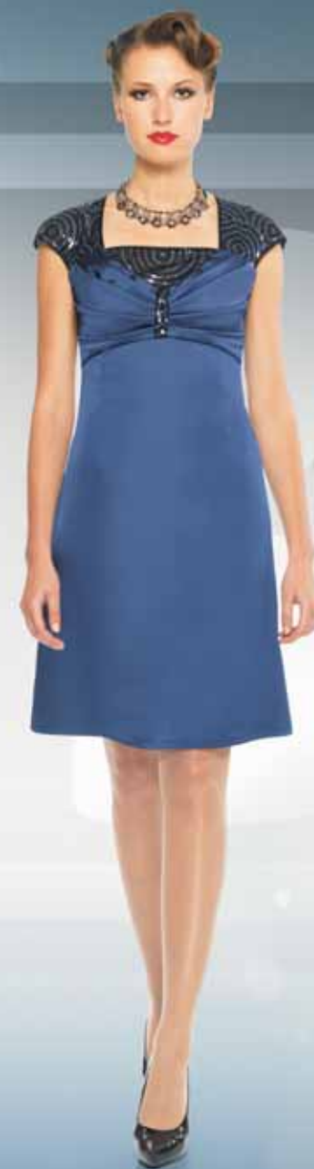
Платье 61142 Р-ры 42-52