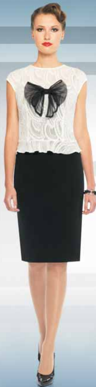
Платье 61752-1 Р-ры 42-54