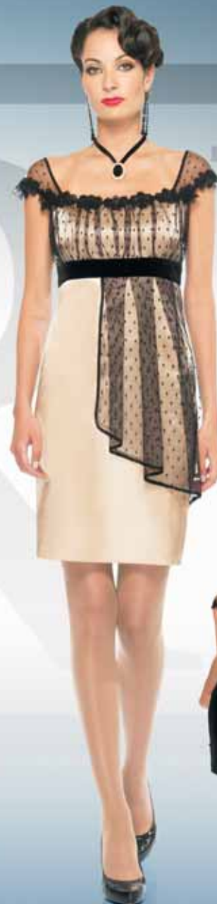
Платье 61262 Р-ры 42-52