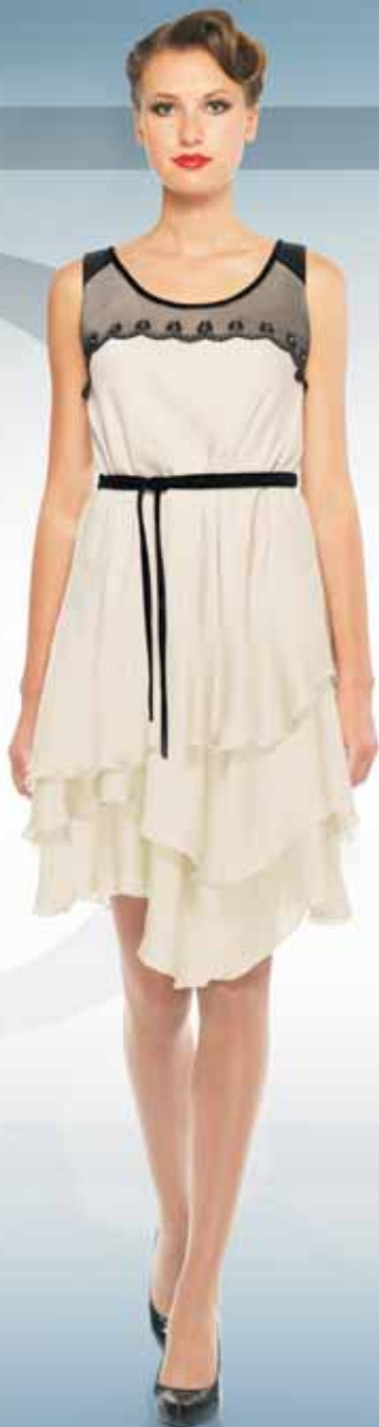
Платье 61302 Р-ры 42-52