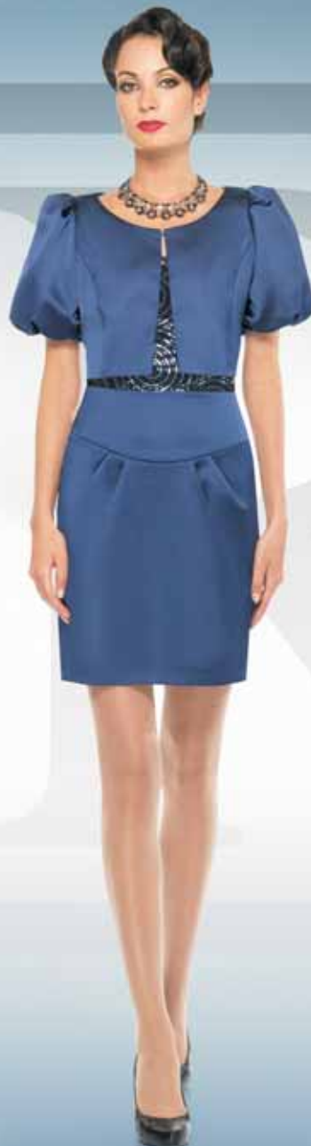
Жакет 11432 Топ 51932 Р-ры 42-54 Р-ры 42-52 Юбка 41232 Р-ры 42-48