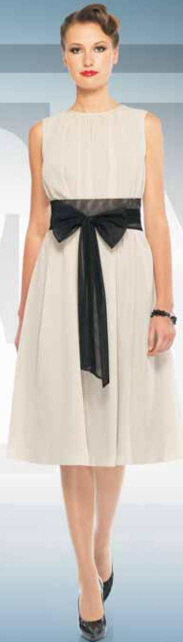
Платье 61782 Р-ры 42-52