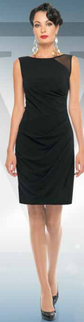
Платье 61292 Р-ры 42-54