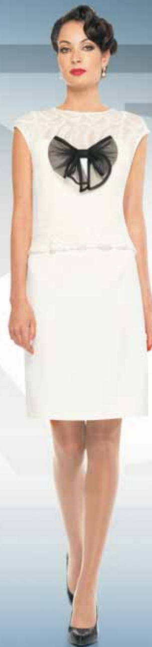
Платье 61752 Р-ры 42-52