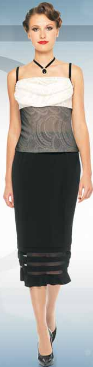
Юбка 41732-D Р-ры 44-54