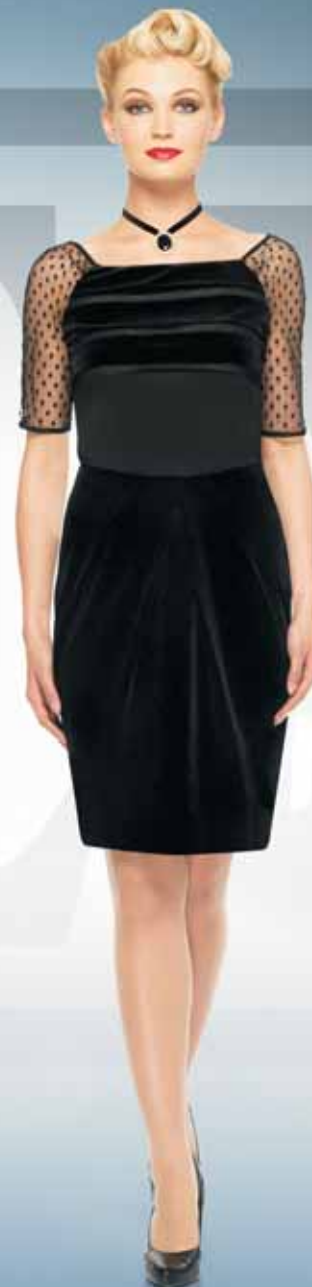
Блуза 21672 Р-ры 42-54