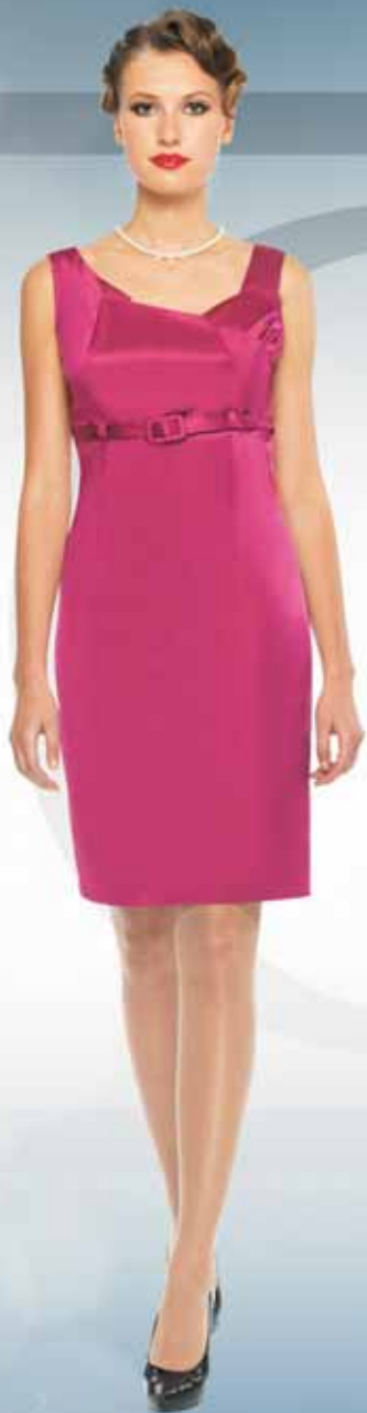
Платье 61422 Р-ры 42-54