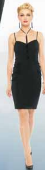
Платье 61592 Р-ры 42-52