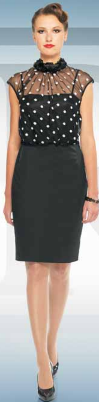
Платье 61162 Р-ры 42-54