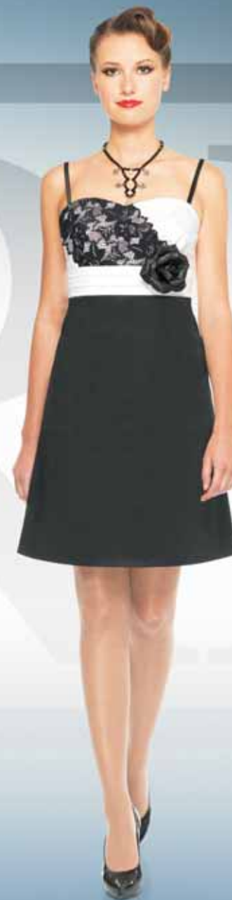
Платье 61072 Р-ры 42-52