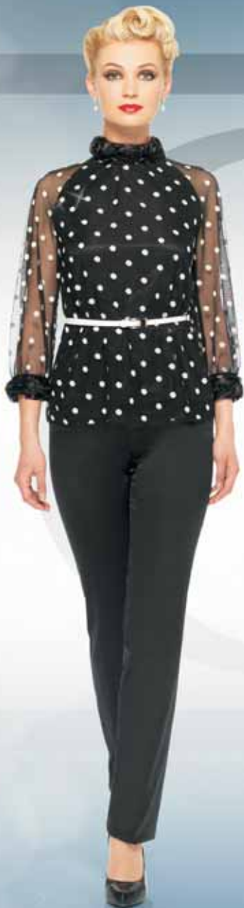
Блуза 21012 Р-ры 42-54