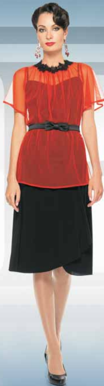
Блуза 21442 Р-ры 42-52