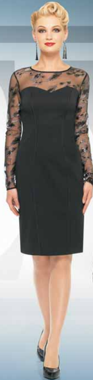
Платье 61172 Р-ры 42-54