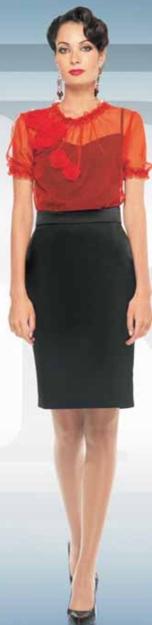
Блуза 21532 Р-ры 42-52