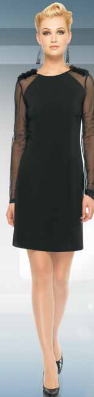
Платье 61382 Р-ры 42-54