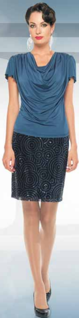
Блуза 21502 Р-ры 42-54