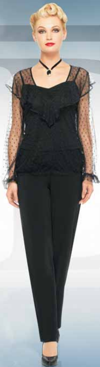
Блуза 21842 Р-ры 42-54