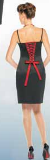
Платье 61182 Р-ры 42-52