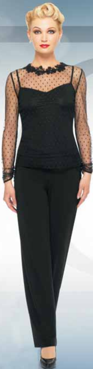
Блуза 21542 Р-ры 42-52