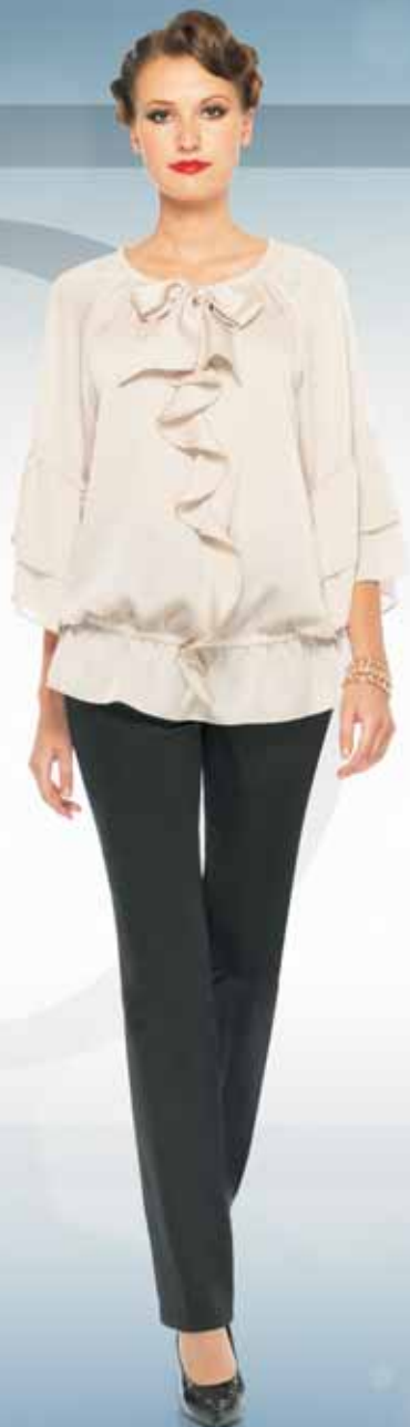
Блуза 21212 Р-ры 42-54