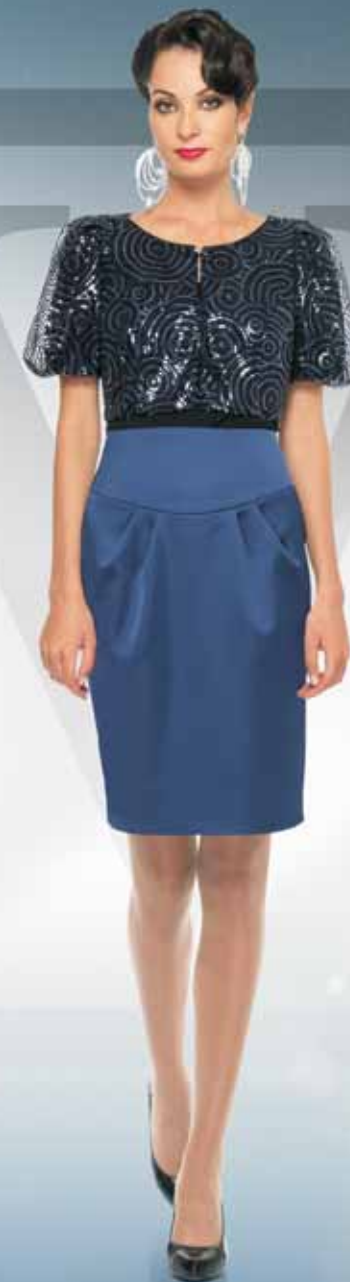
Жакет 11882 Р-ры 42-54