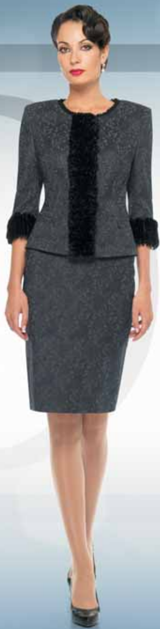
Жакет 11112 Р-ры 42-54