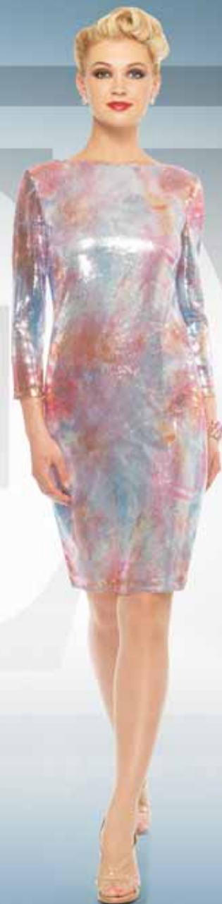
Платье 61352 Р-ры 42-54