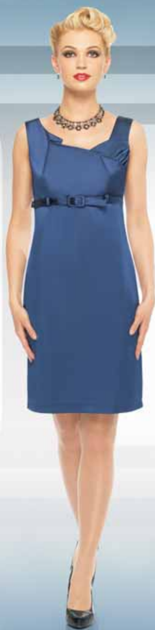
Платье 61422-4 Р-ры 42-54