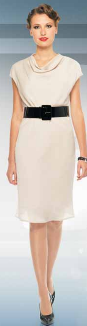
Платье 61872 Р-ры 42-54