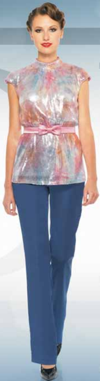
Блуза 21472 Р-ры 42-54 Брюки 31832 Р-ры 42-54