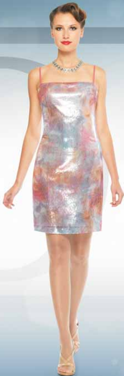
Платье 61452 Р-ры 42-52