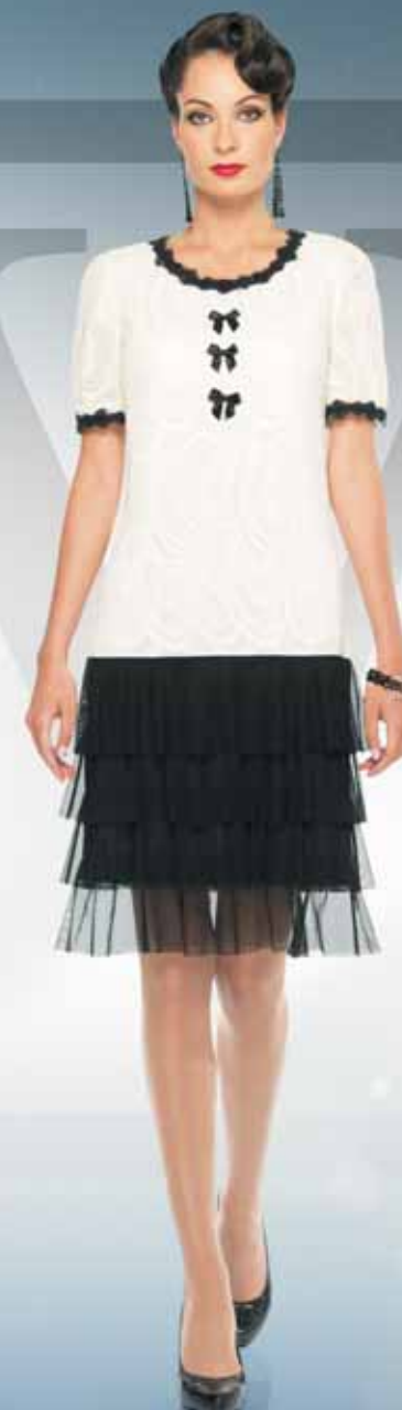
Платье 61792 Р-ры 42-52