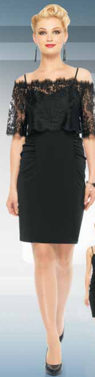
Топ 51582 Р-ры 42-52