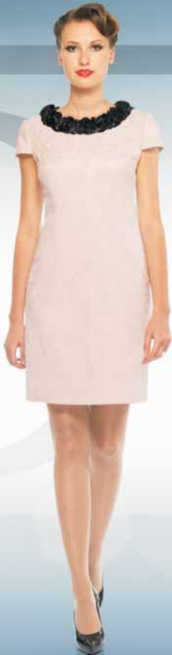
Платье 61772 Р-ры 42-54