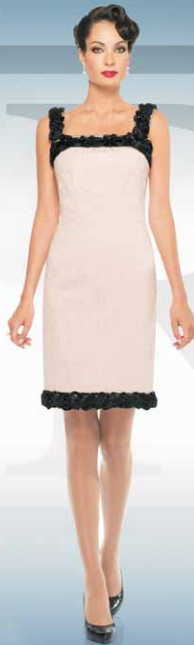
Платье 61132 Р-ры 42-54