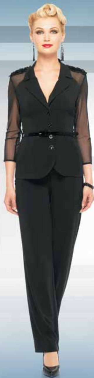
Жакет 11372 Р-ры 42-54