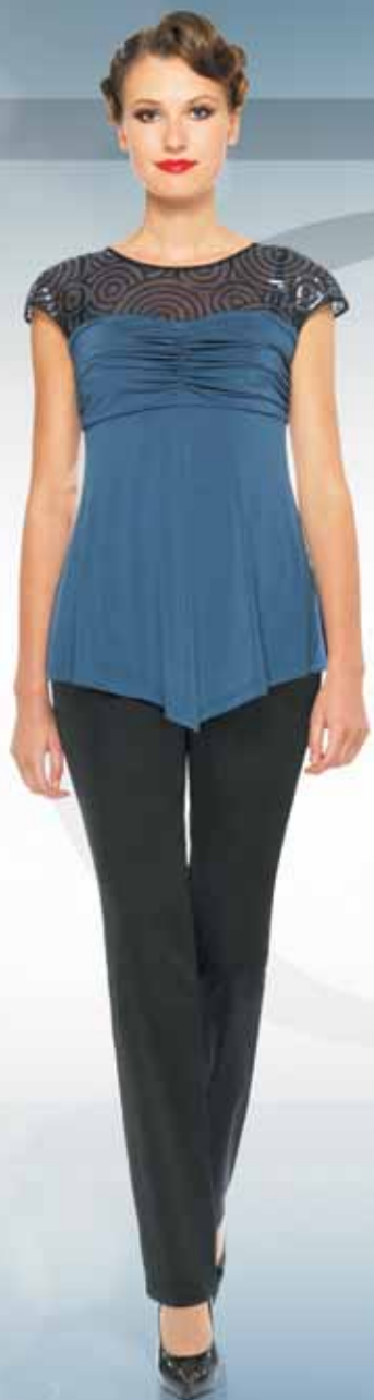
Блуза 21492 Брюки 31912 Р-ры 42-54 Р-ры 42-54