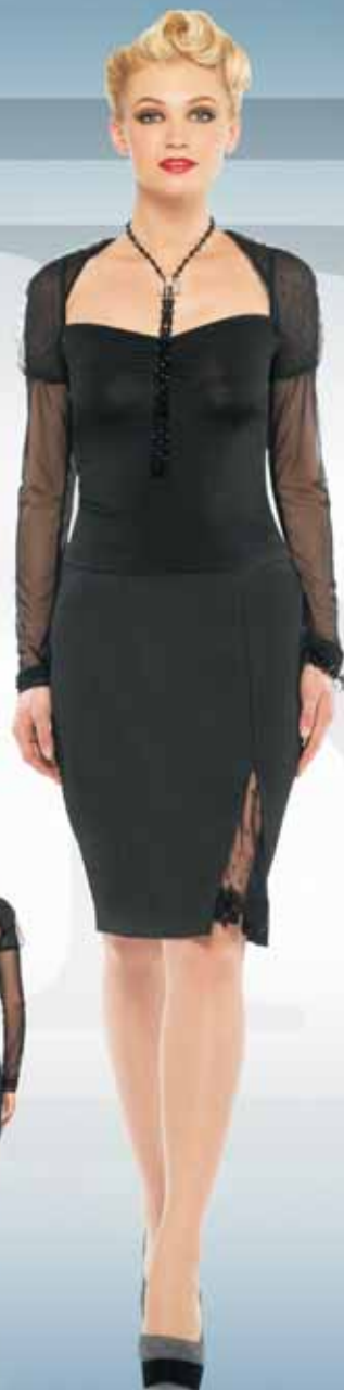
Жакет 11902 Р-ры 42-52