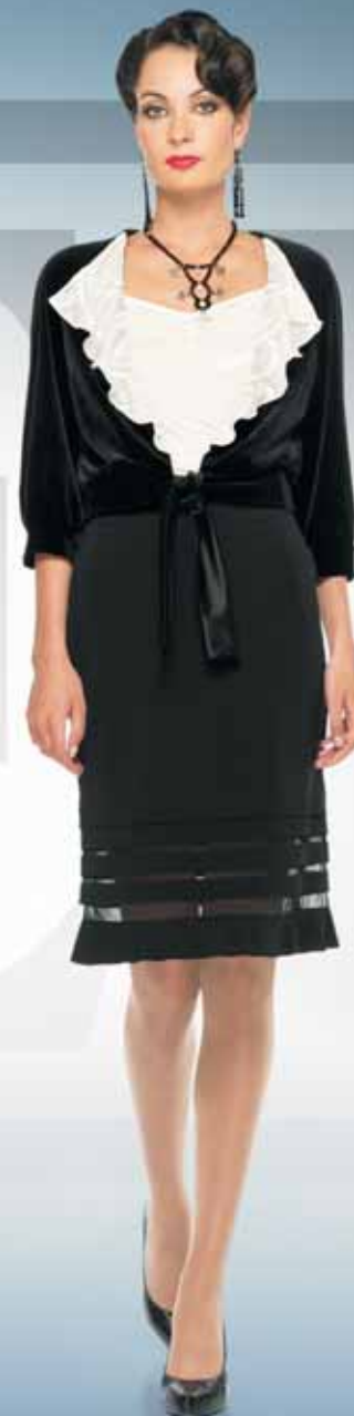
Жакет 11742 Топ 51332-2 Р-ры 42-52 Р-ры 42-54