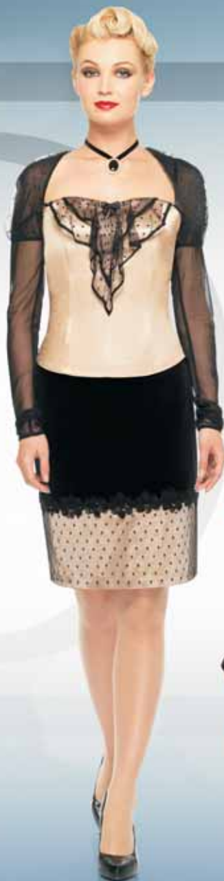
Жакет 11902 Р-ры 42-52