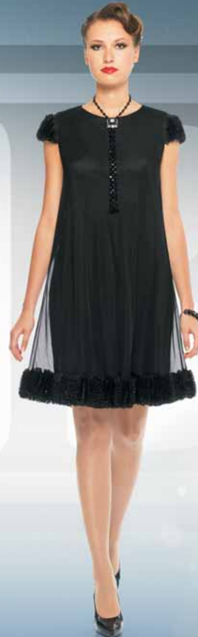
Платье 61052 Р-ры 42-52