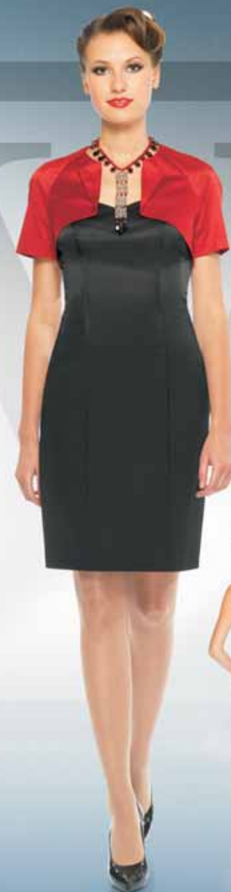
Жакет 11082-3 Р-ры 42-52