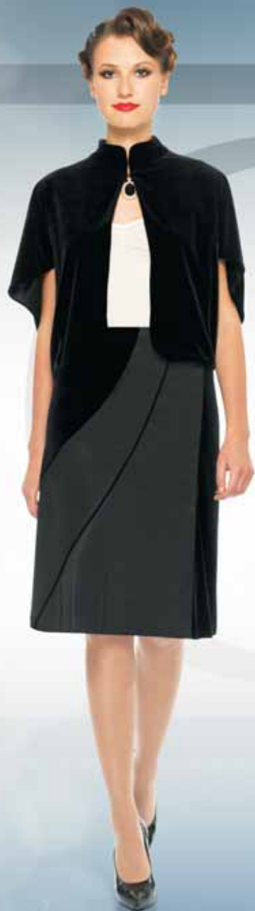
Жакет 11922 Р-ры 42-54