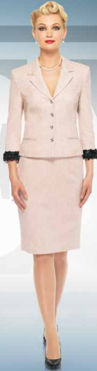
Жакет 11062 Р-ры 42-54