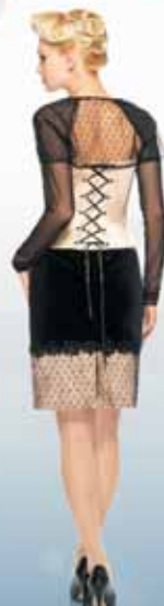
Топ 51862 Р-ры 42-50