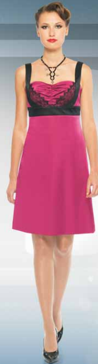
Платье 61192 Р-ры 42-52