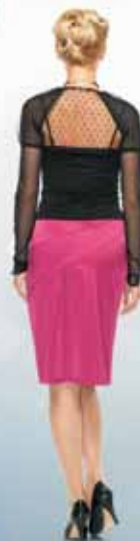
Топ 51332 Р-ры 42-54