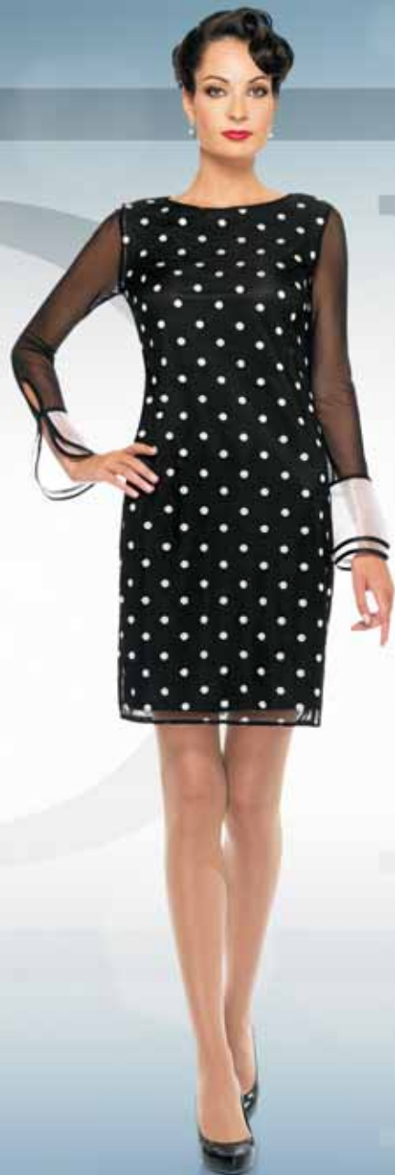
Платье 61802 Р-ры 42-54